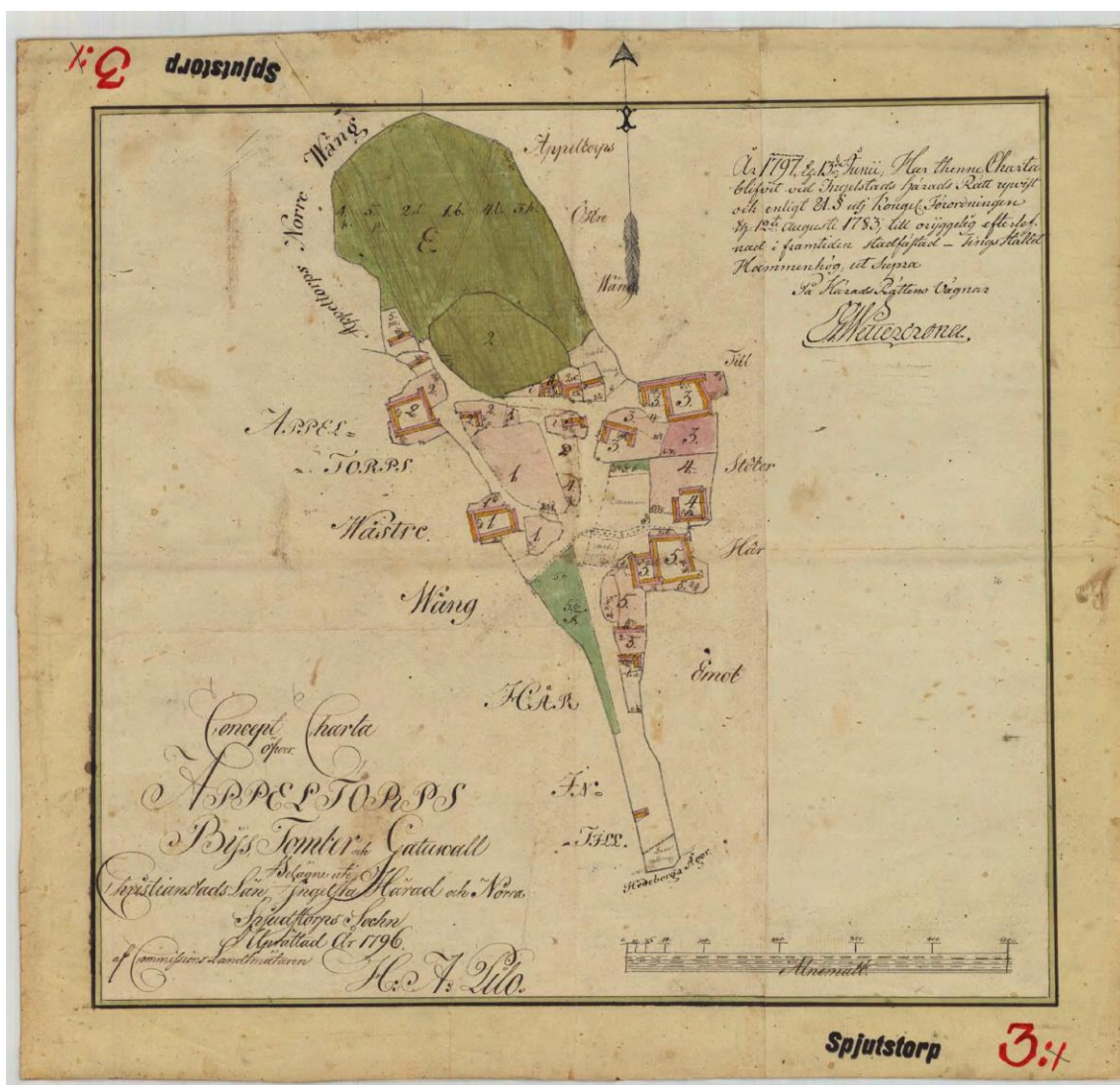
Appeltorp by 1796